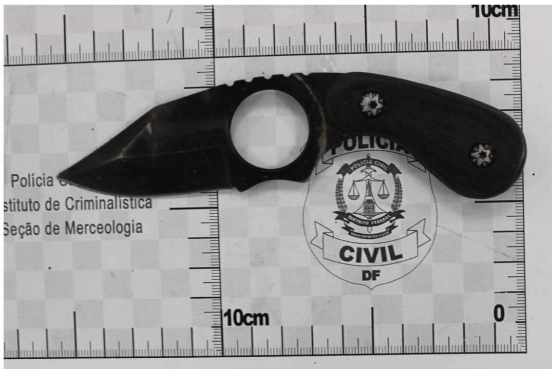
Fotografia 3 – Material examinado.