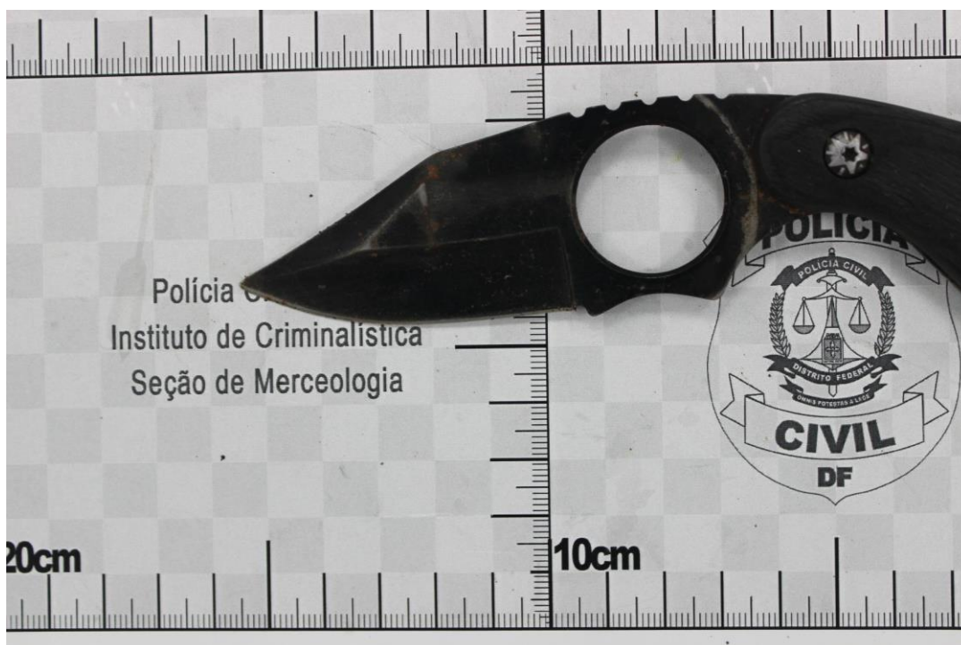
Fotografia 4 – Material examinado.