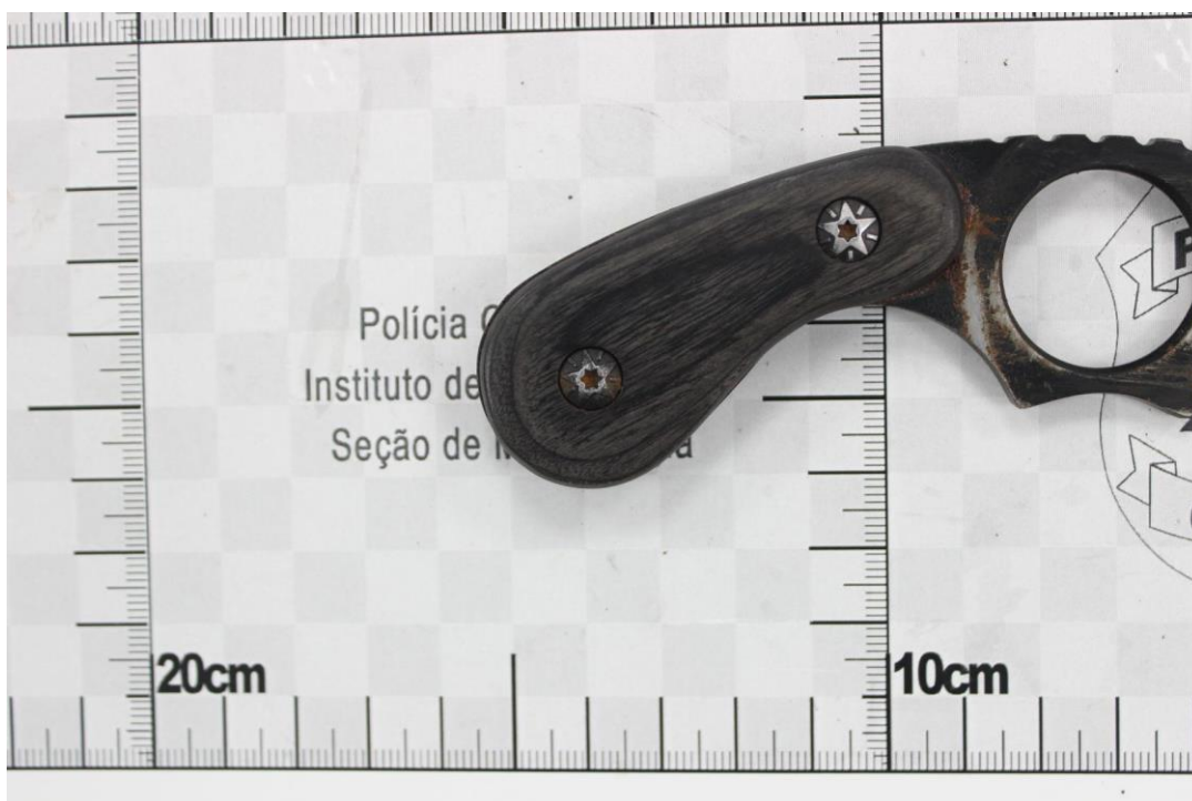
Fotografia 8 – Material examinado.