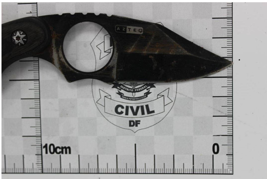
Fotografia 7 – Material examinado.