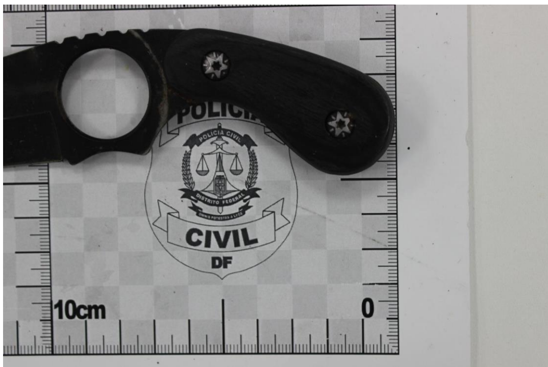
Fotografia 5 – Material examinado.