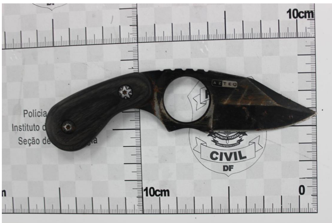
Fotografia 6 – Material examinado.