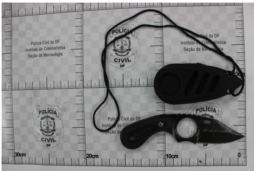
Fotografia 2 – Material examinado.